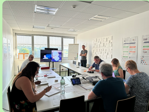
La situation est étudiée pour apporter la meilleure réponse possible