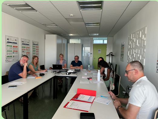
Les membres de la cellule de crise de la CPTS MA en pleine réunion

Il a également été noté qu'il manquait un biologiste au sein de la cellule de crise de la CPTS MA. Un tel profil nous paraît important, notamment pour analyser rapidement les éventuelles données biologiques à disposition. Nous lançons donc un appel à tout biologiste intéressé pour rejoindre notre cellule de crise. Pour transmettre votre candidature ou en savoir plus, contactez-nous à : crise@cpts-mulhouse-agglo.fr .